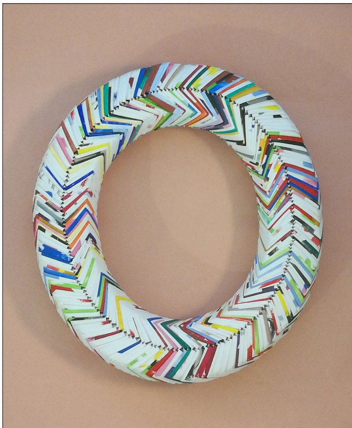
© Sabine Boquier - concordance des temps - papier, 42x49cm - 2019