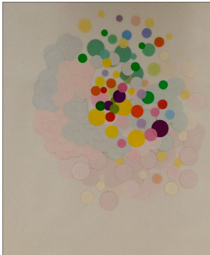
© Louise Fabre - Sans titre - collage sur papier, 42x59.4cm - 2018

Pour cette exposition aux Réservoirs de Limay, Sabine Boquier et Louise Fabre mettent en dialogue dessins et sculptures issus d'une démarche plastique convoquant la polychromie d'objets et de matériaux du quotidien collectés, les couleurs sont ainsi glanées. Cette démarche s'inscrit dans une perspective artistique invitant au « changement de valeur d'usage d'un objet », un concept né d'une pratique plastique apparue à la jonction des XXe et XXIe siècles. Alors qu'on annonçait la mort de la peinture, les artistes n'ont pas cessé d'élaborer des compositions colorées jouant notamment de matières disponibles, manufacturées et non-artistiques, pour élaborer des pratiques qu'on peut définir par « Ready-made color »* non sans référence à Duchamp. (*Antoine Perrot).