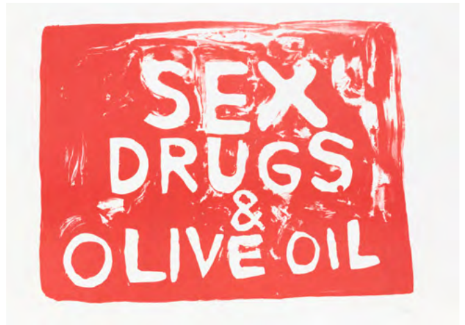
Damien De Lepeleire, That's All My Body Needs , seconde édition. Impression offset à plat (photolithographie) sur papier Stonehenge 250g. Format 69 x 49 cm. Une édition de 20 exemplaires signés, numérotés et poinçonnés + 6 exemplaires HC.