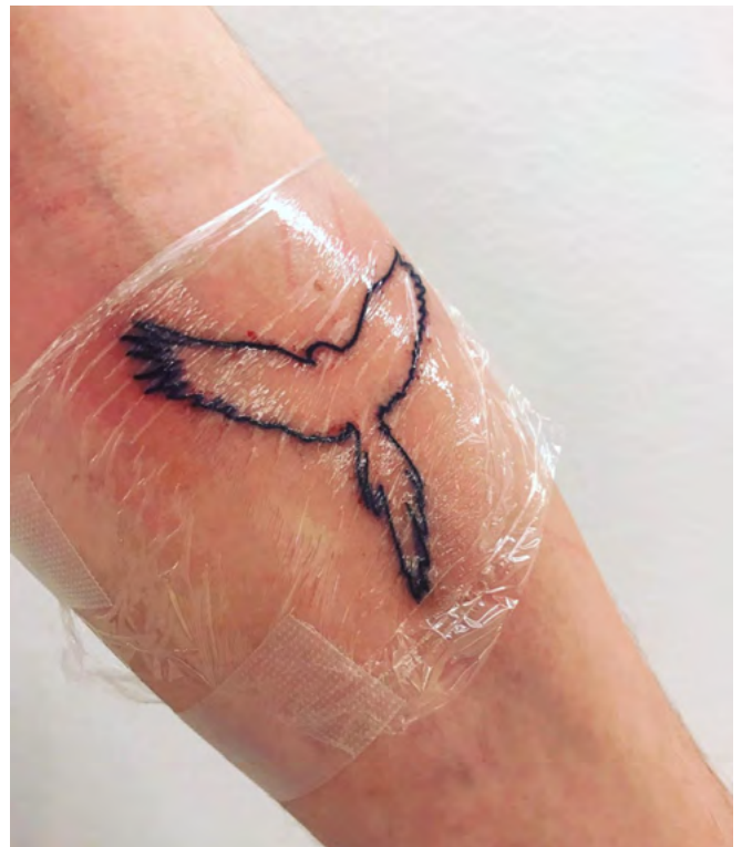
Didier Clain, Le Perroquet (Migration, édition 3/3), 2021, performance, The Tattoo Studio (The Lost Chapter), Centre Pompidou, Paris