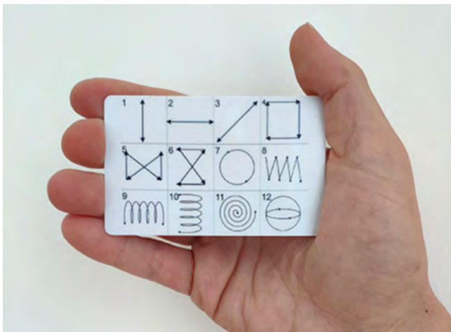
Marc Buchy, Gymnastique oculaire , 2019, performance, protocole, cartes postales

Pour toute demande de visuels HD : samantha@art-et-communication.fr