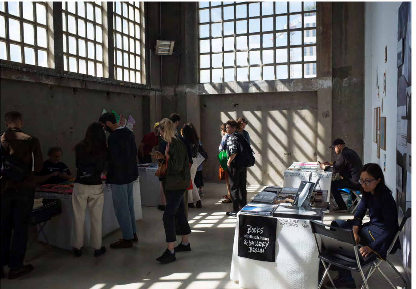
MAD7 MULTIPLE ART DAYS 9 10 11 SEP. 2022 FONDATION FIMINCO