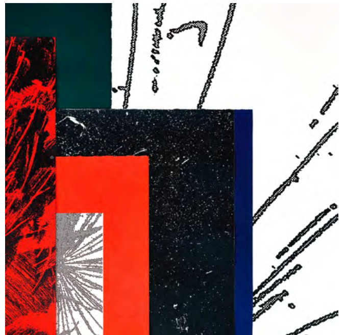
Alain Rodriguez et Yann Owens, Fireworks#2 , 2023, installation, sérigraphie, impression au rouleau, risographie, photocopie, 400 x 112 cm, Scénographie : Kevin Cadinot, Photographies : Olivier Roche, Imprimeur et éditeur : Franciscopolis Éditions