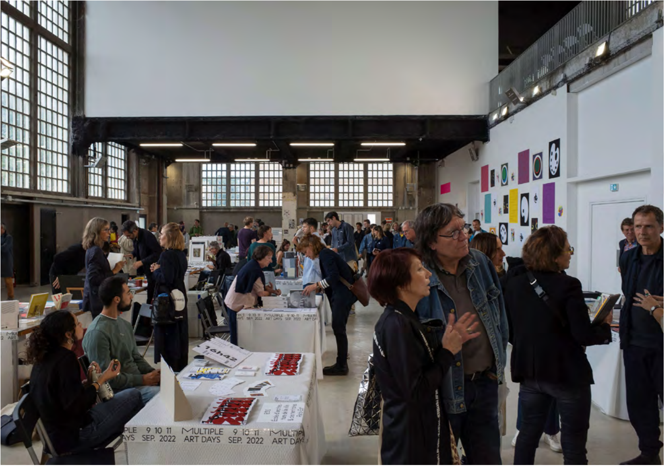
MAD7 MULTIPLE ART DAYS 9 10 11 SEP. 2022 FONDATION FIMINCO