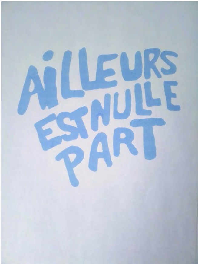
Pascal Frison, Ailleurs est nulle part , 2023, caisson ajouré, lettrage Plexiglas, néon 55x75x7 cm, 5 exemplaires numérotés et signés