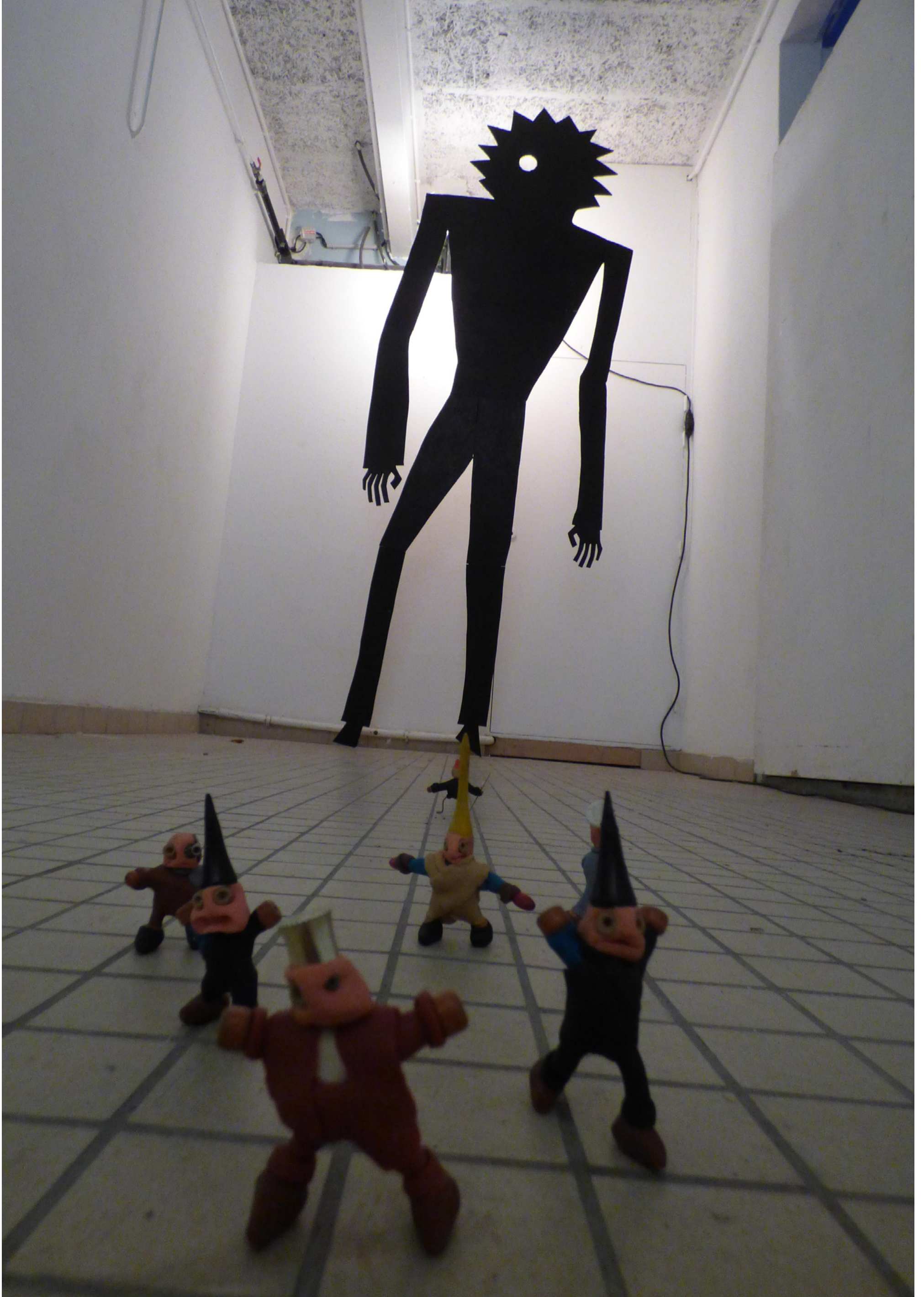
Grand et Petits êtres. 2017 Grand :250cm Bois contre-plaqué, verre de loupe, peinture noire. Petits : 5cm pâte-à-modeler, petits objets.