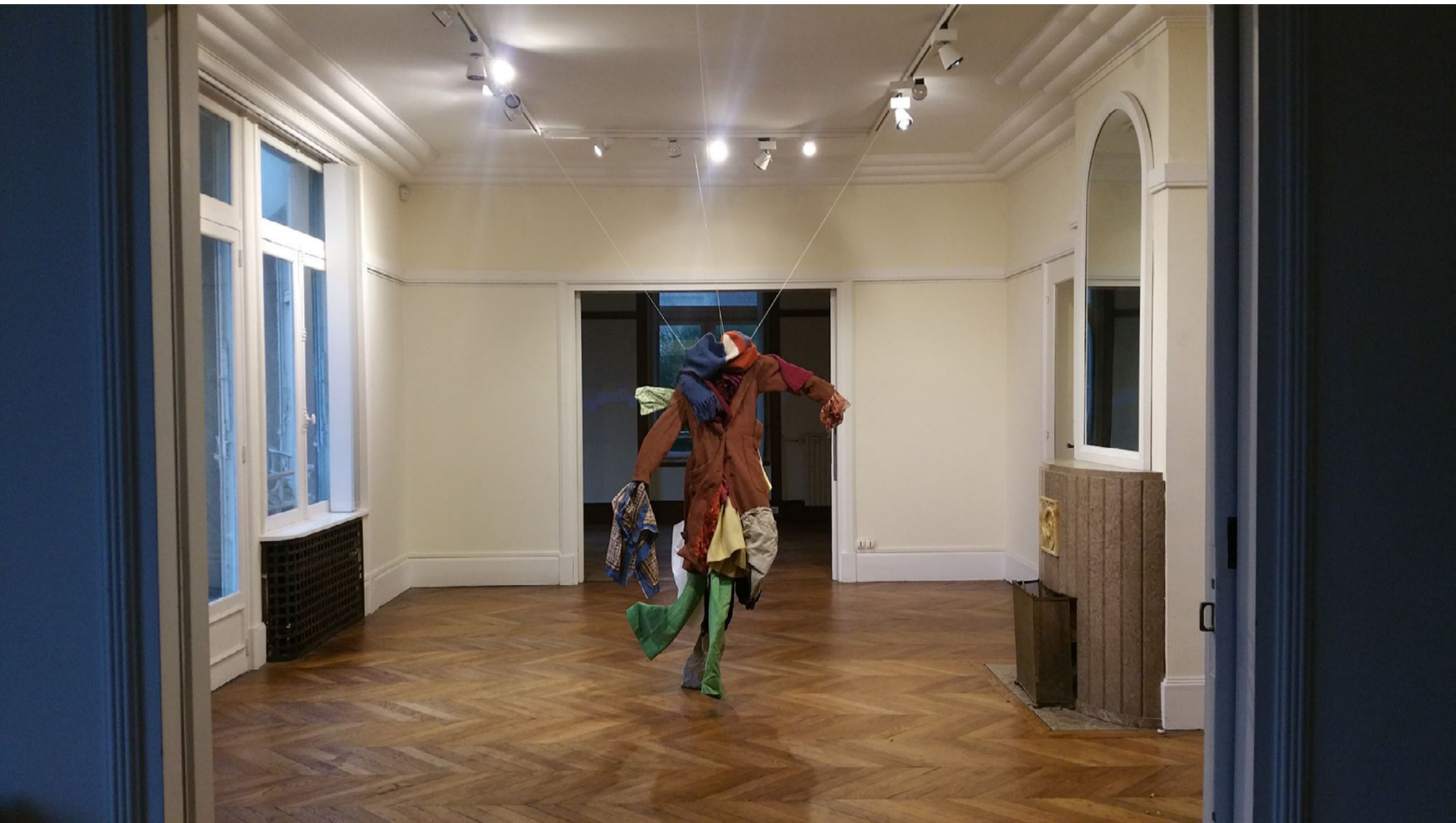
Souvenirs débraillés. 2018

Ensuite je produis des installations où ces différents éléments seront mis en scène selon le contexte: le lieu, le moment, l'histoire du lieu.