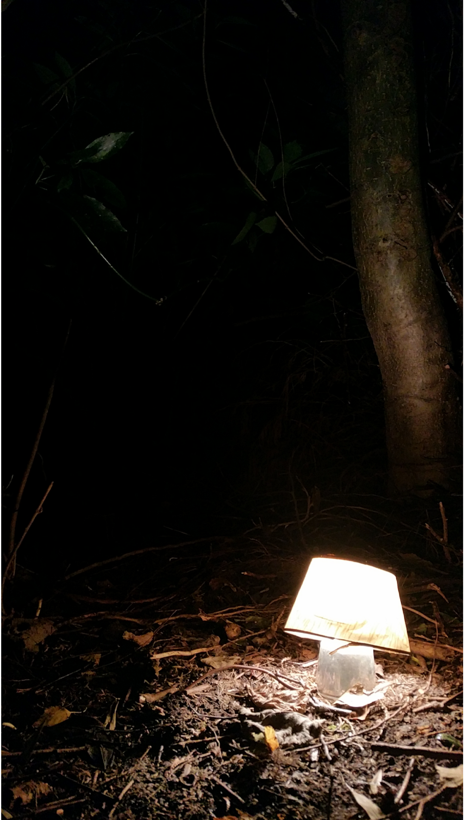
Là. 2018 Dimensions variables. Branchages, lanterne, abat jour. Un bizarre sentiment de confort à un endroit étrangement précis.

réalisée au cour de l'exposition: «Là comme ça».