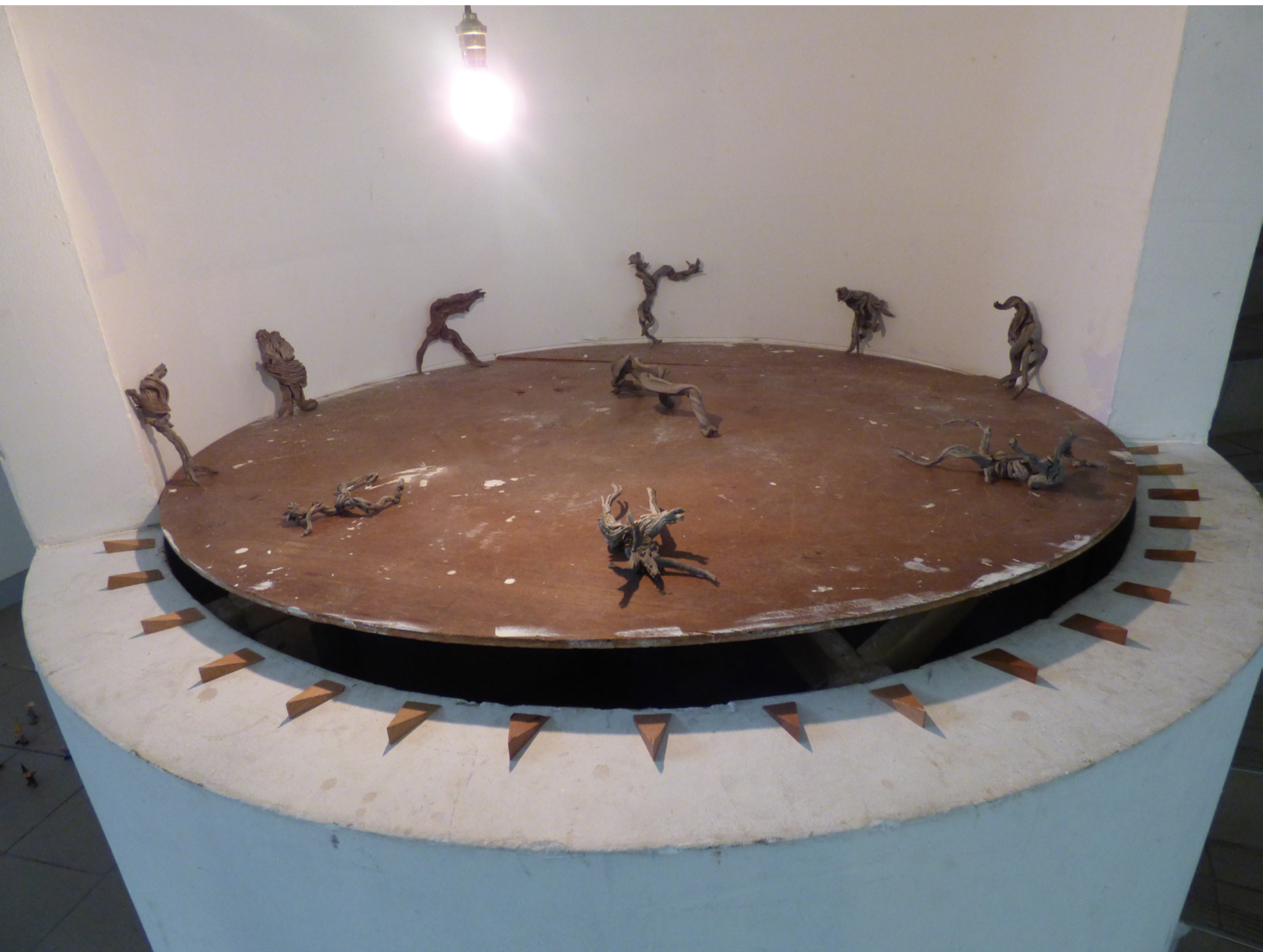
Sarabande. 2019 Dimensions variables. Cèdres à croissance lente, lumière, musique. Ces morceaux de Cèdres extrait du cratère Stephanos dansent au bord du gouffre.