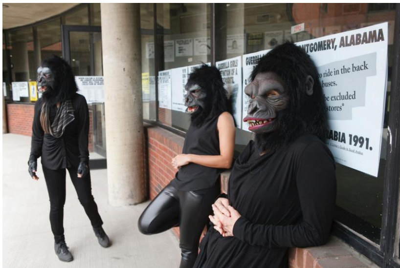
Guerrilla Girls at Abrons

Depuis 1985, Les Guerrilla Girls sont la conscience du monde de l'art. Chiffres à l'appui, elles dénoncent comment les artistes de genre féminin sont ignorées ou en situation de grande minorité dans les musées et les galeries, les collections comme les médias.